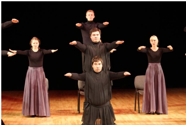
Рис. 13. Пластика хора