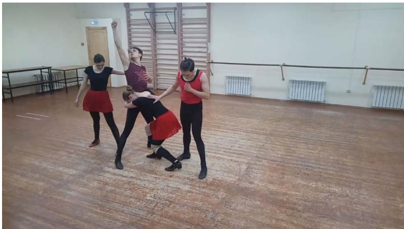
Рис. 15. Формирование гражданственности. Новелла «Молодогвардейцы»