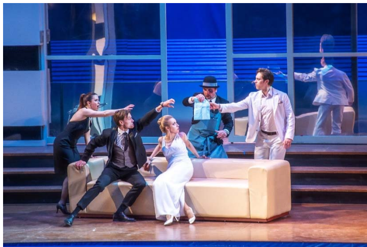
Рис. 2. Двигательная культура певца. Сцена из оперы «Свадьба Фигаро»