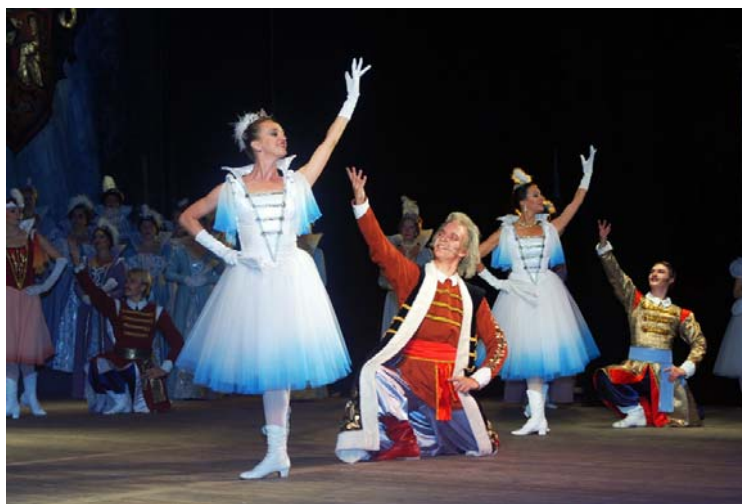
Рис. 14. Мазурка из оперы «Иван Сусанин»