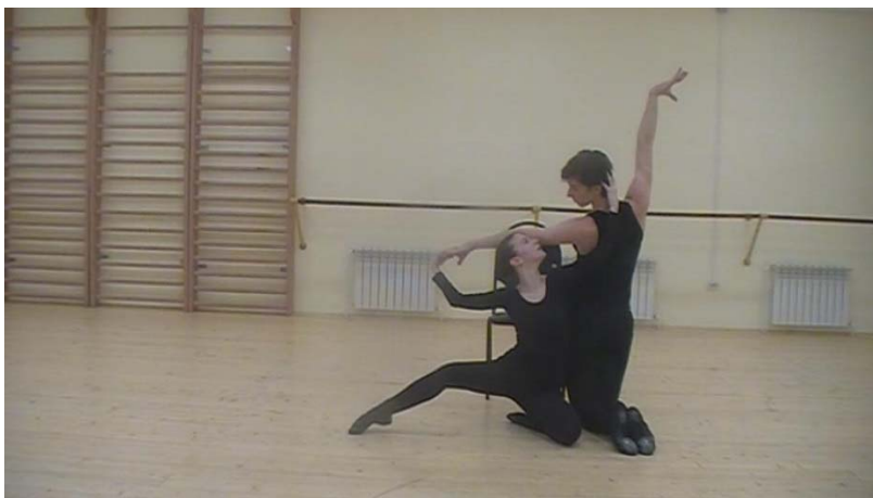
Рис. 16. Хореография С. Эрзи. Дуэт Леда и Лебедь