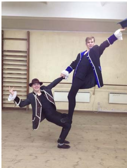
Рис. 3. Основы преподавания пластики. А. Тихомиров, А. Хозяев