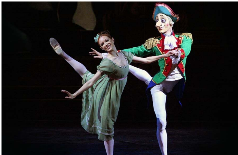
Рис. 17. Щелкунчик. Мариинский театр