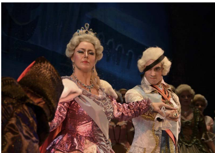
Рис. 10. Невербальный язык. Т. Гарькушова, А. Кошелев – Екатерина II и Потёмкин