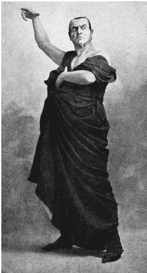
Рис. 19. Ф. Шаляпин в роли Мефистофеля