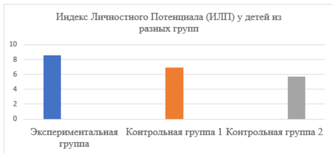
Рис. 2. Индекс Личностного Потенциала (ИЛП) у детей из разных групп

Интегральным показателем личностного развития в акмеологическом аспекте является обобщенный Индекс Личностного Потенциала (ИЛП), вычисленный как среднее арифметическое от показателей самооэффективности, волевой регуляции, мотивации достижения и социальной компетентности.