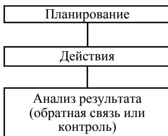
Рис. 1.1.1. Укрупненная схема управленческого процесса

В данном случае контроль – это заключительный и обязательный этап любого процесса принятия решения. Это упрощенное понимание контроля.