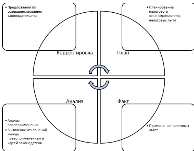
Рис. 1. Использование цикла Деминга-Шухарта 166 в законотворческой и правоприменительной практике

Несмотря на то, что выгоды использования цикла PDCA очевидны, но в юридической сфере он еще мало используем. По отдельности все элементы системы существуют: план, факт, анализ, отклонение, но связей между ними нет или они неверны. Например, законодатель решил простимулировать какую-либо сферу общественных отношений, предоставив для развития этой отрасли налоговые льготы, но из-за слабой юридической техники сделал это некорректно. Правоприменитель, толкуя нормы права по-своему, отклоняется от исходной цели законодателя. На этапе контроля, вышестоящий орган (например, ФНС РФ) анализирует правоприменение, выявляя противоречия в правоприменении. А на этапе контроля он ограничивается выводами, закрепленными в своих решениях, не передавая свой анализ законодателю. Таким образом, рвутся правильные связи системы, что сказывается на ее устойчивости и развитии.