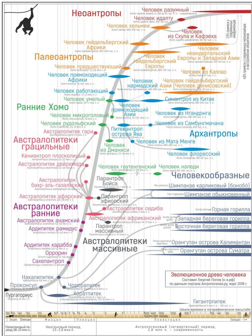
Рис. 2.1.1. «Эволюционная родословная человека» (автор Георгий Попов, по данным портала «АНТРОПОГЕНЕЗ.РУ») 8