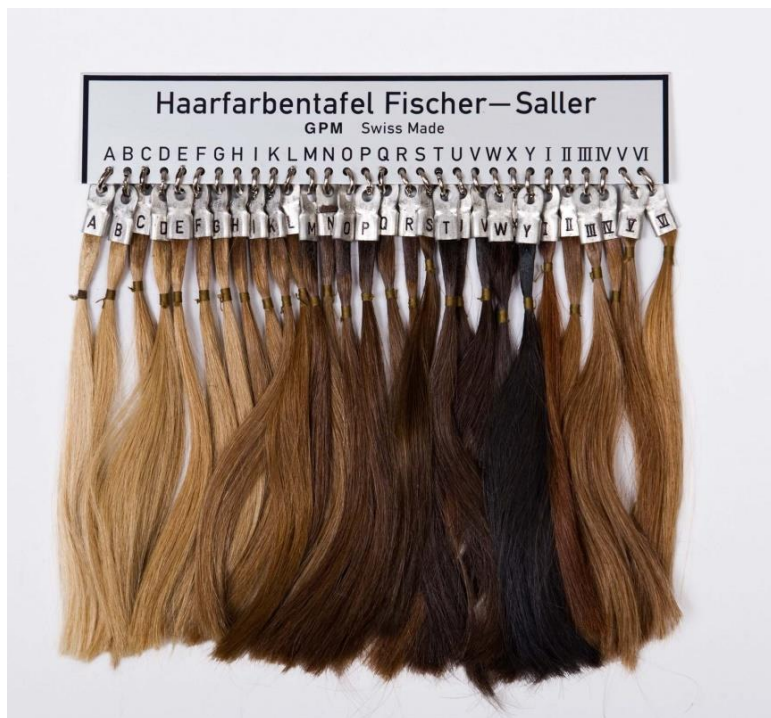
Рис. 3.1.3. Шкала Фишера-Саллера: рыжие, белокурые (0), светло-русые (1), русые и светло-каштановые (2), тёмно-русые и тёмно-каштановые (3), чёрно-каштановые и чёрные(4) (при отсутствии шкалы можно использовать следующее описание: чёрные, чёрно-бурые, тёмно-каштановые, красно-каштановые, светло-каштановые, тёмно-белокурые, светло-белокурый, пепельно-белокурый, рыжий, альбиотический)

Наблюдается взаимосвязь между степенью пигментированности кожи, волос, радужины глаз, но не всегда. Альбинизм встречается с одинаковой частотой во всех расах.